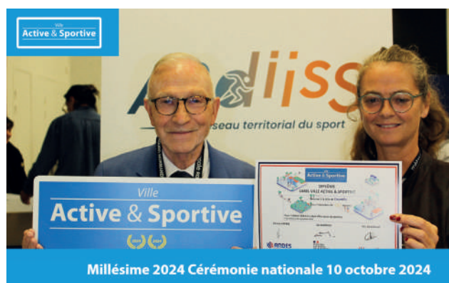
Millésime 2024 Cérémonie nationale 10 octobre 2024

Ce label, gage de reconnaissance et de qualité pour Chantilly !